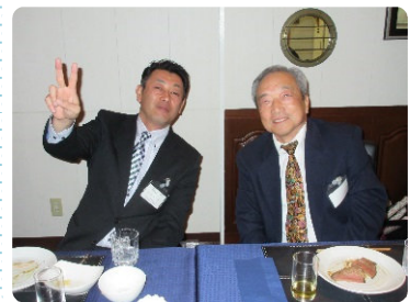
サインはV!...古いカナ?(船をイメージした丸窓にも注目)

フランス料理にドリンクは世界のワイン・ビール・酒等の飲み放題。 出席の皆さんは夫々に仕事や健康、将来の事等様々な話題で盛り上がりました。 1時間30分の予定を30分程経過した所でお開きとなりましたが、帰りは船酔い したのでしょうか?覚束ない足取りで下船していただきました。 (お疲れ様でした) その後の航海の行先は...各位おまかせで～す!